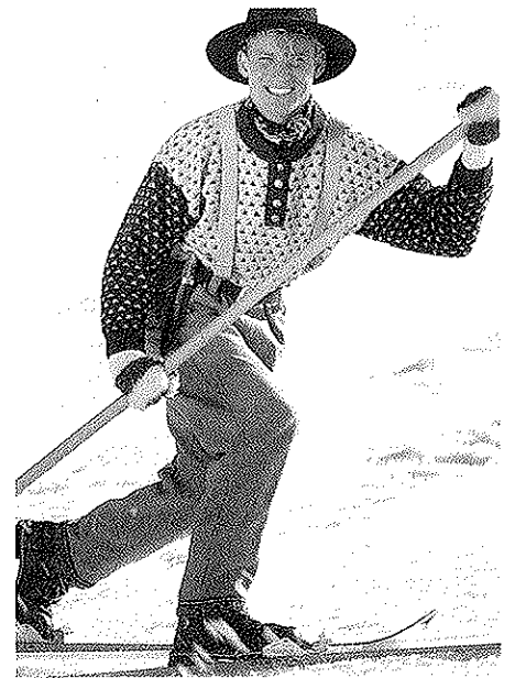
Sy i ermene. Sy i knapper.